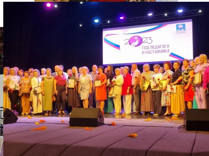
Традиционный прием по внесению имен педагогов, «Золотую книгу образования города Астрахани» (40 000 руб.)