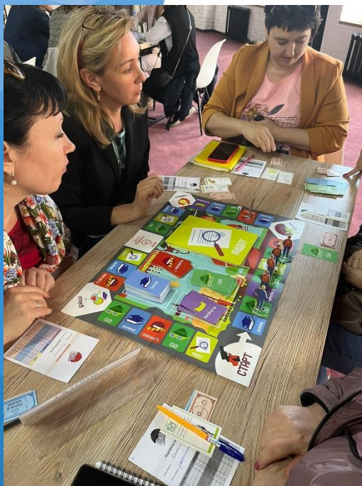
Семинар-игра по охране труда «Герои в касках»