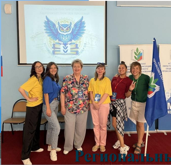
Региональный профсоюзный форум «Аставник»