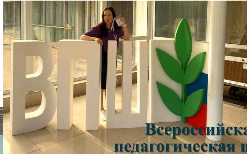
Всероссийская педагогическая школа Профсоюза